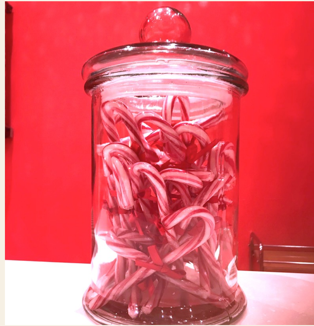
Création d'une pièce-montée de Bonbons à la couleur et de bonbonnières sur-mesure