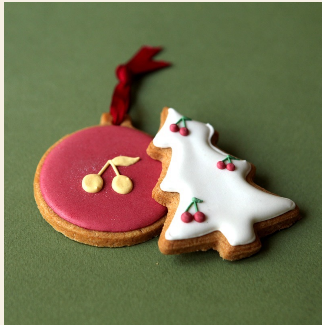
Création d'une collection de Sablés décorés de Noël, inspirés de l'ADN de la marque BONPOINT