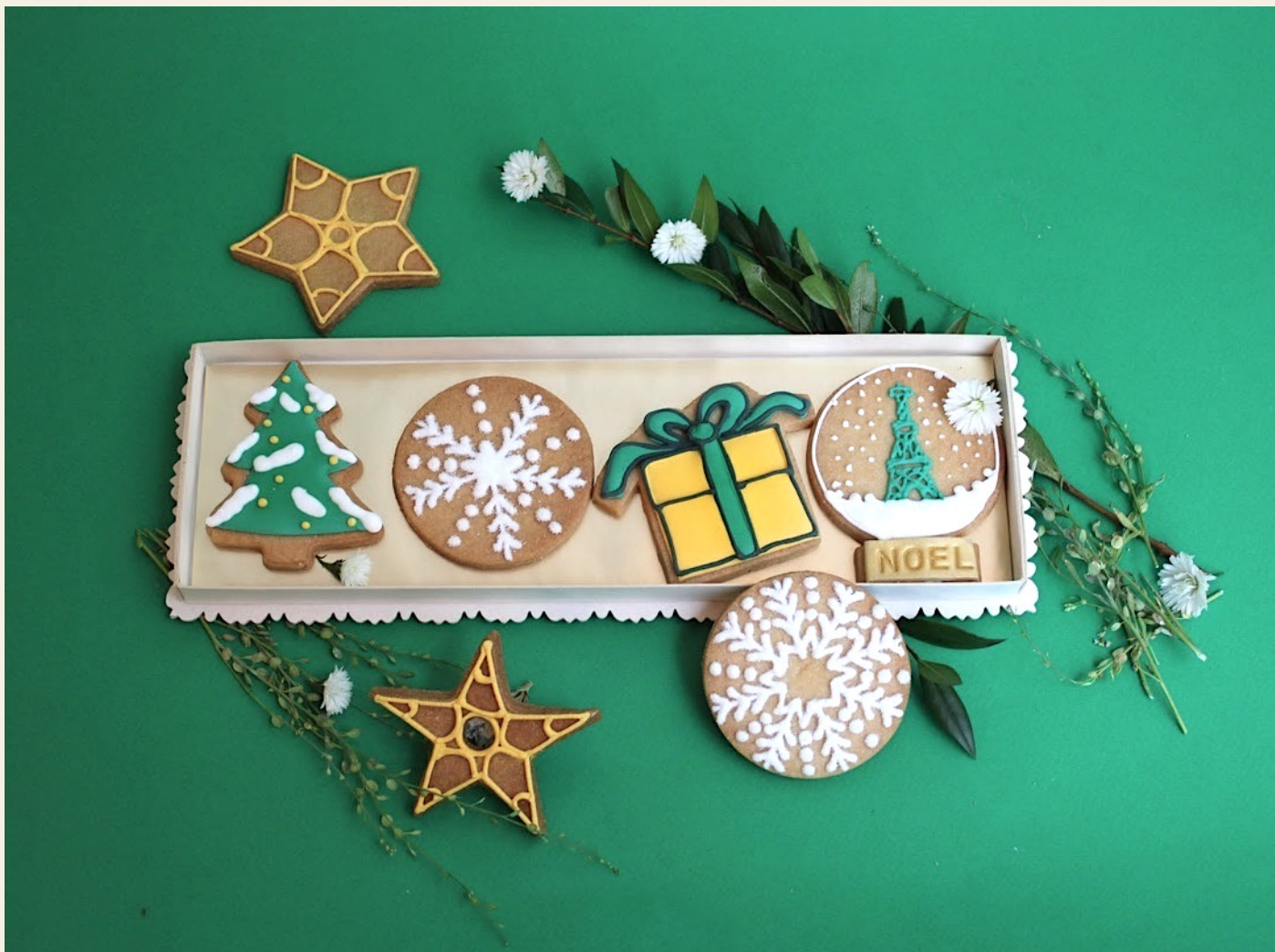
LA SAMARITAINE PARIS