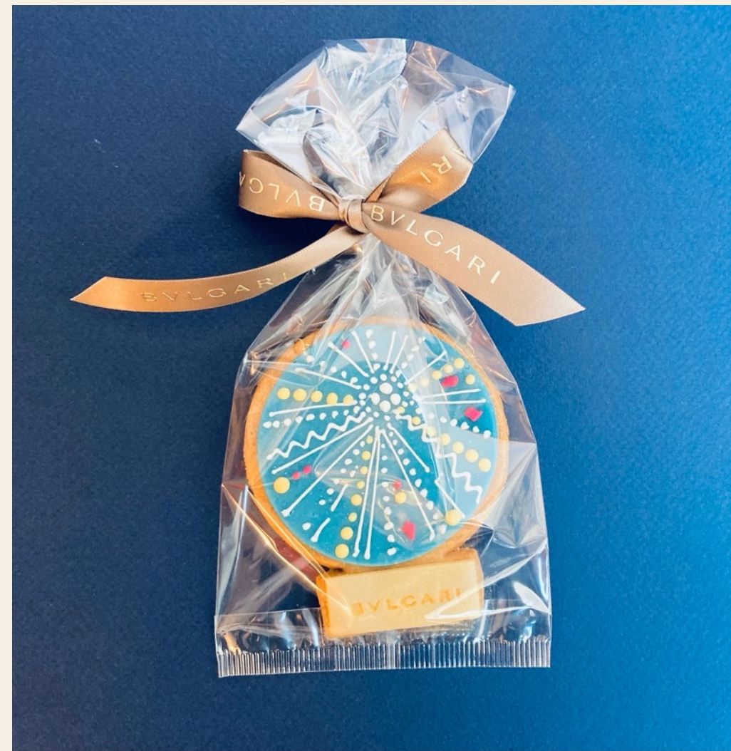
Création de Sablés décorés à la main et de coffrets sur-mesure pour BVLGARI