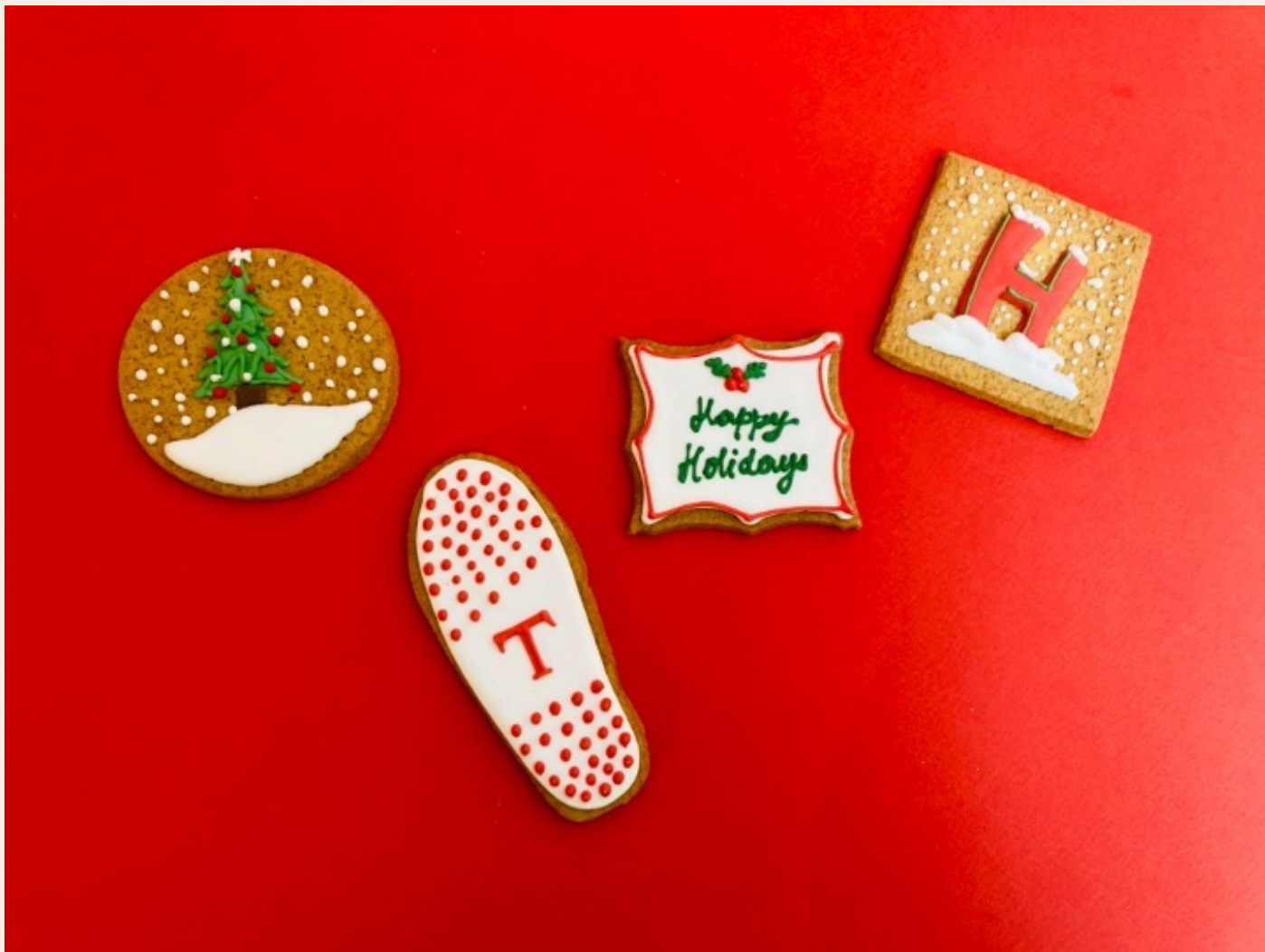
TOD'S x HOGAN