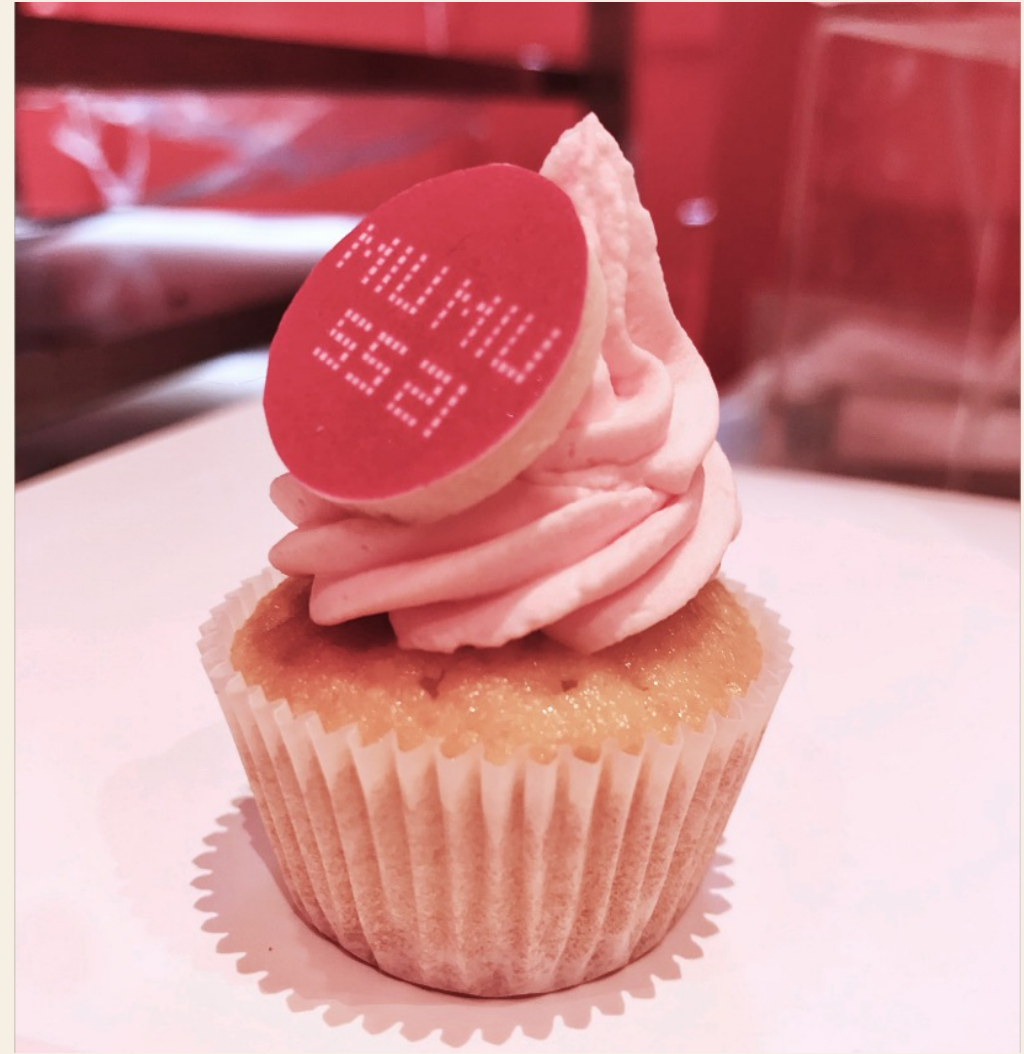
Collection de Mini-Cupcakes proposés ici avec une impression alimentaire