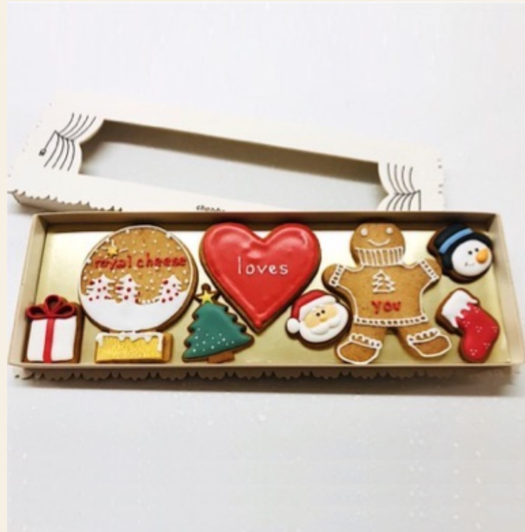
Mise en valeur des Sablés décorés sur-mesure dans un coffret Chez Bogato