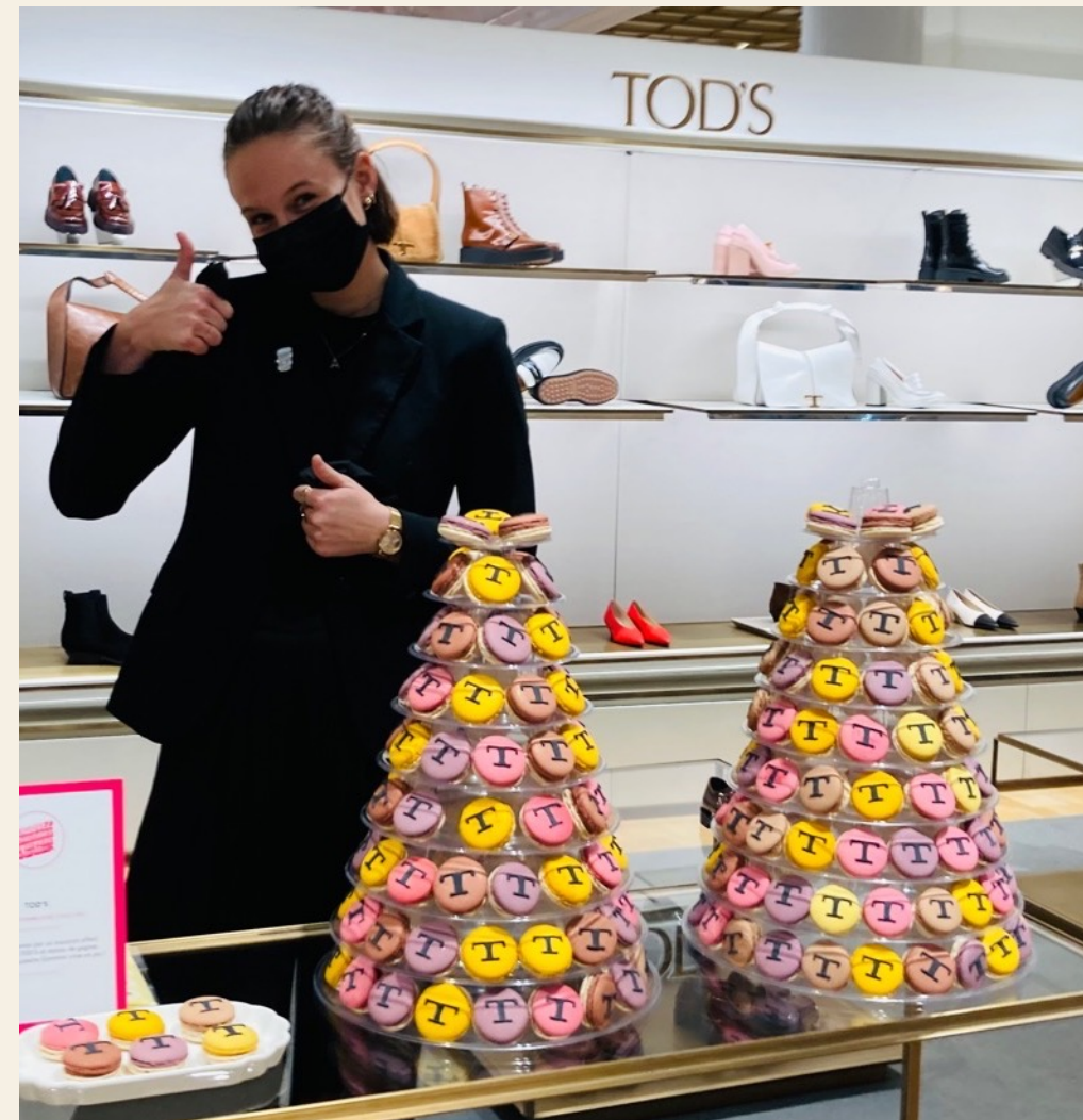
Création d'une collection de Macarons décorés sur-mesure pour Noël ou dans l'ADN de la marque